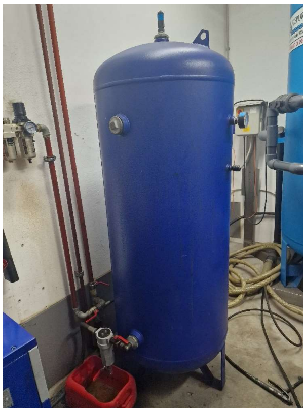
Tlačna posoda – rezervoar za zrak