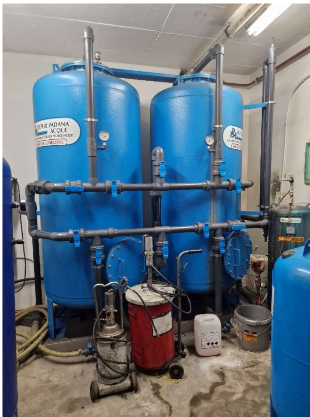
Čistilna naprava za vodo