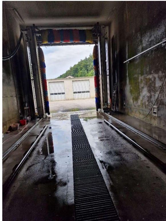
Pralnica za tovorna vozila